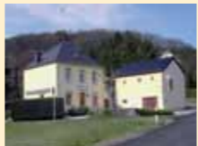
Café Hemsteler Gare, Hemstal