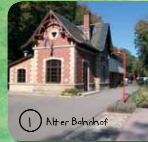
1 Alter Bahnhof