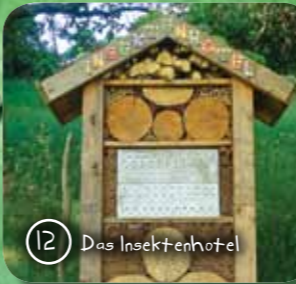
12 Das Insektenhotel

3 Waldtieren auf der Spur Kennst Du die Tierspuren bekannter Waldtiere? Welches Tier war denn hier unterwegs? Lerne die Spuren zu deuten!