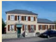
Café Mamer-Weyrich, Altrier