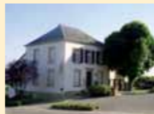
Café Zetteger Gare, Zittig