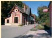
Restaurant Becher Gare, Bech